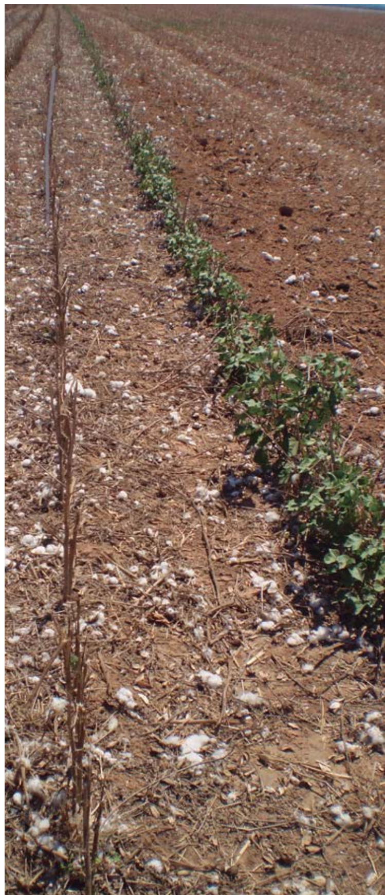
Linha Testemunha auxiliar ao lado das parcelas que receberam aplicação de herbicida na destruição de soqueira.

Num futuro próximo, variedades com resistência adicional ao herbicida 2,4-D deverão chegar ao mercado, e nessas a destruição química de soqueira poderá ficar comprometida, considerando as atuais ferramentas hoje disponíveis.