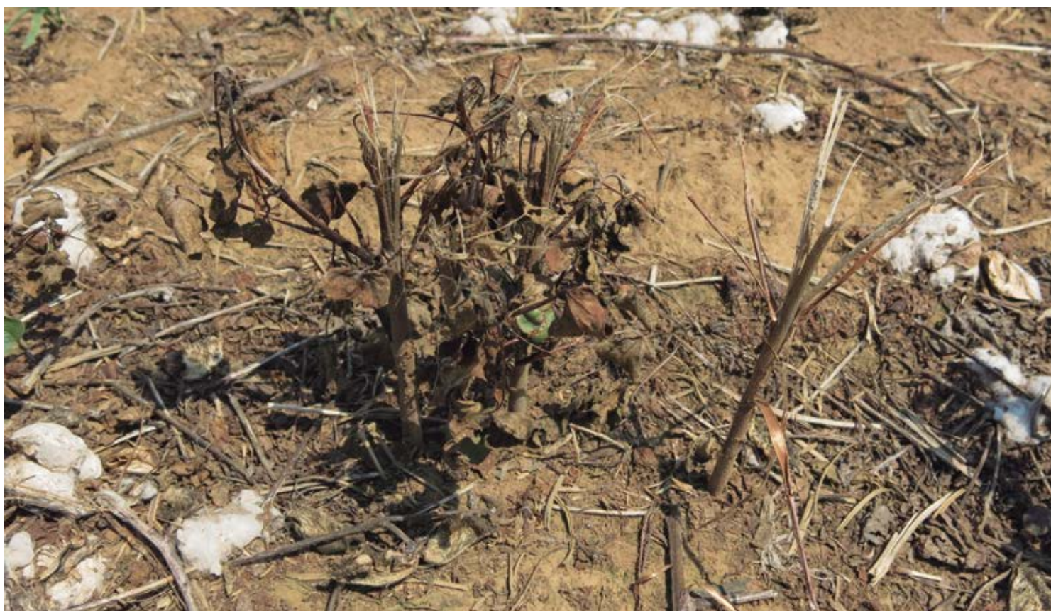
Soqueira, 15 dias após a aplicação de herbicidas, Ensaio Campo Verde.